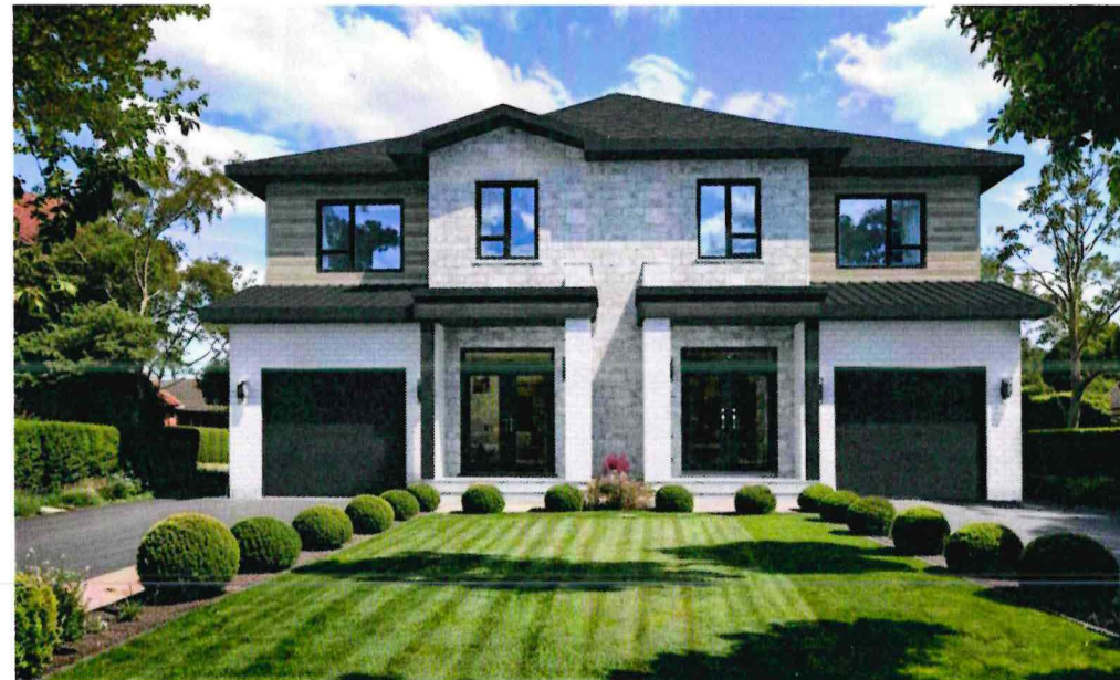
212 et 208, rue Dupuis