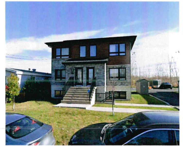
200 à 204, rue Dupuis