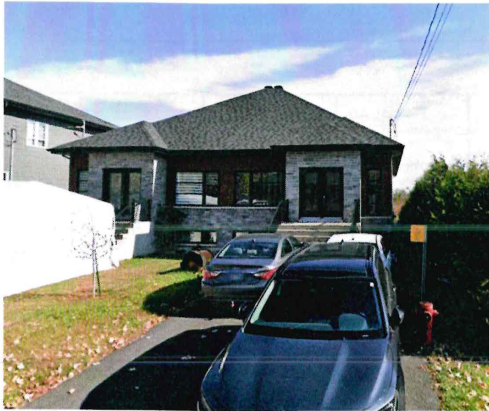
220 et 216, rue Dupuis